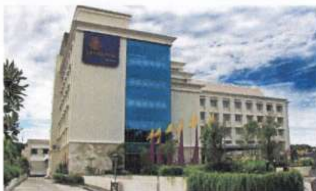
Hotel Grand Inna Muara Jl. Gereja No. 34 Belakang Tangsi Padang 25118 Sumatera Barat, Telp. 0751-35600